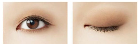
『ヴィセ』が提案する“新・囲み目メイク”のイメージ

今シーズンの『ヴィセ』では、“囲み目メイク”をジェンダーレスに提案します。“囲み目メイク”は、アイカラーやアイライナー等で目の周りを囲むように塗布するメイクのことで、1990年代にもトレンドになったメイク方法です。当時は、黒や濃い茶色などの色を、ライン状にくっきりと塗布して仕上げるのが主流でしたが、今回『ヴィセ』が提案するのは、透けるような色味のアイカラーを上下のまぶたに塗布することで、自然な陰影が演出された、“新・囲み目メイク”です。「ニュアンス マット クリエイター」のパレットの上で、4色すべての色を指で混ぜ、そのまま上下のまぶたに往復しながら塗布するだけで仕上げるこ