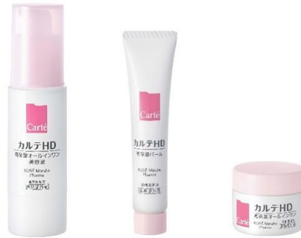
① ② ③