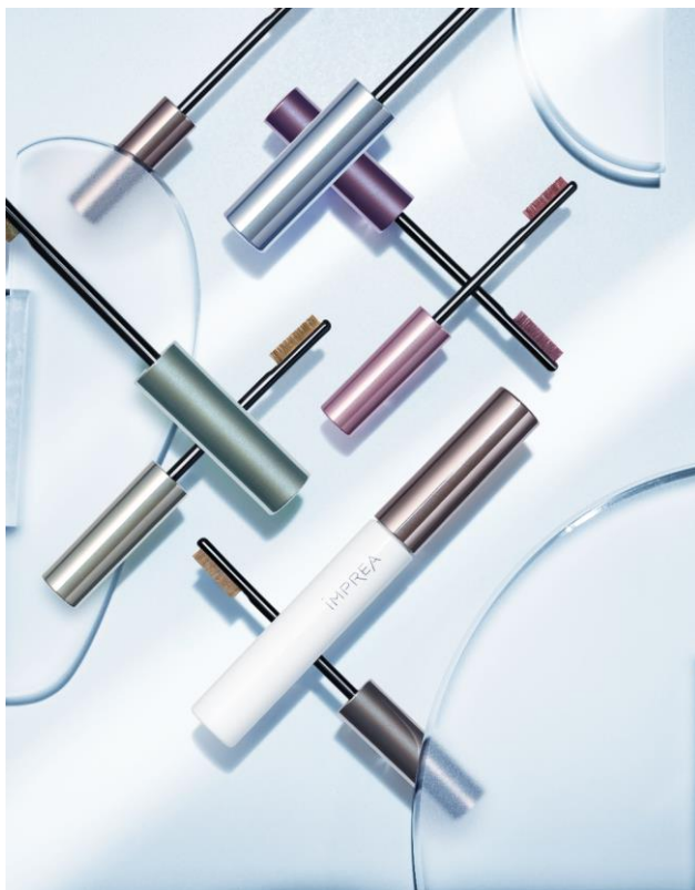
インプレア アイブロウ マスカラによる 「眉」×「髪」の印象プロデュース例

コーセー ミルボン コスメティクス 株式会社(本社:東京都中央区、代表取締役社長:藤原 弘枝)は、美容室専売化粧品ブランド『インプレア』から、ヘアの美容提案とあわせて印象をプロデュースする「インプレア アイブロウ マスカラ」「インプレア アイブロウ ペンシル」などの新製品(5品目 13品種、税抜 500円～3,500円)を2021年3月1日より、全国のインプレア取扱い美容室にて発売します。