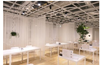
＜自由にスペースを作成＞