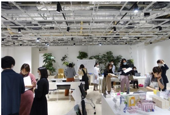
研究アイデア提案会議の様子