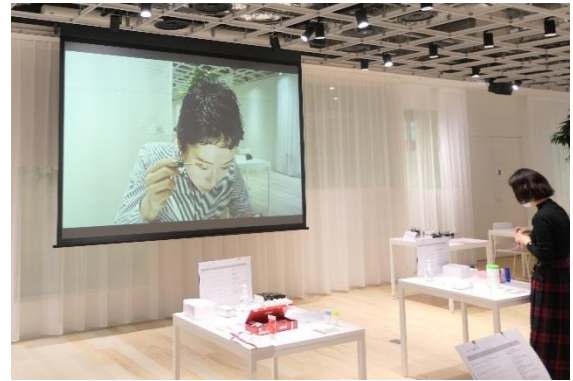
美容開発部の評価を放映

一方で、在宅勤務中の社員が視聴できるよう社内のイントラネット上でオンライン配信も行い、幅広い社員へ誘発の機会を提供しました。