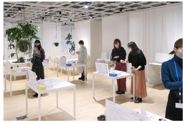
外注フェスタの様子

当社は、これまで“コトづくり”の本社(日本橋)、“モノづくり”の研究所(王子)、“ヒトづくり”の研修センター(王子)を東京都内に配置し、有機的かつ機動的に連携してきました。今後、グローバル戦略を支える多様性を育み、社内外の幅広い知見を活かすオープンイノベーションを加速させると共に、常識に囚われない柔軟な発想による顧客提供価値の創出を狙い、その推進拠点として、新たに本年 3 月、日本橋本社 7 階に「KoCoLabo」を開設しました。「KoCoLabo」は、 KOSÉ Collaboration Laboratory の頭文字をとり命名し、社員のリフレッシュや情報交換の場、セミナーの開催、試作品の評価や新ビジネスの PoC(実証実験)の場として活用していきます。