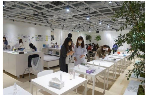
研究員と本社社員が意見交換する様子

例えば、口紅の上から塗ることで色落ちや色移りを防ぐという新機能を提案し、口紅コートという新たなジャンルを確立した「リップ ジェルマジック EX」や、クリームとしては珍しいホイップのような独特の感触を持つ「雪肌精 クリアウエルネス ホイップ シールドクリーム」など、独自性の高い特長・感触を持った商品が、研究所員の新発想・新技術から数多く生まれています。