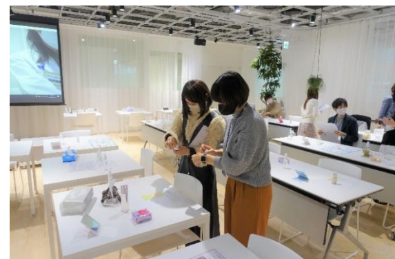
試作品を試している様子