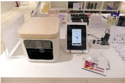
＜ヒアリング・実証実験＞