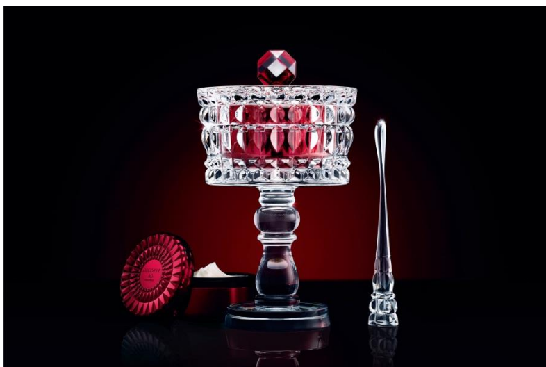
【スタンドはバカラ社のクリスタルガラス製、スパチュラは樹脂製】

『コスメデコルテ』50周年記念品として、「コスメデコルテ AQ ミリオリティ インテンシブクリーム n Baccarat Edition」(1品目1品種/500,000円税抜)を、2021年2月16日より全国の百貨店と化粧品専門店で、数量限定で発売します。グローバルでは、日本を除く12の国と地域(中国、香港、台湾、韓国、シンガポール、タイ、マレーシア、フランス、イギリス、スペイン、イタリア、アメリカ、)で販売します。