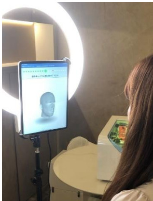
【パーソナライズドシートマスク作成イメージ】

株式会社コーセー(本社:東京都中央区、代表取締役社長:小林 一俊)は、当社のコンセプトストア「Maison KOSÉ」において、12月のコンセプトストアオープン以来、初めての追加となるデジタルを活用した最先端の“ビューティアトラクション”を導入します。3D スキャンによる個々人の顔型に合わせたシートマスクの提供と、ブローバーにて画像解析による毛髪診断システムの実証実験およびスタイリストによるカウンセリングと施術を展開します。