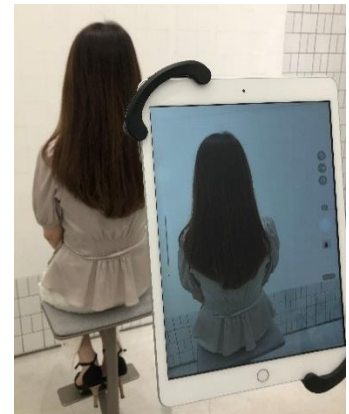
【毛髪診断システム】

2019年12月にオープンした「Maison KOSÉ」は、デジタルと体験を融合させた新たなコミュニケーションの場として、当社のブランドを横断した様々な美容コンテンツを展開しています。異業種とのコラボレーションをはじめ、社内に蓄積されたノウハウと外部リソースを融合することで、独自性の高いサービスを追求してきました。当社ではこれらの取り組みを“ビューティアトラクション”と称し、オープン時には「Snow Beauty Mirror」や「ネイルプリンター」など新しい美容体験を提供してきました。この度、新たに二つの企業との協業により、独自の新しい価値を提供し、お客さま一人ひとりに合わせたパーソナライズ美容提案を強化していきます。