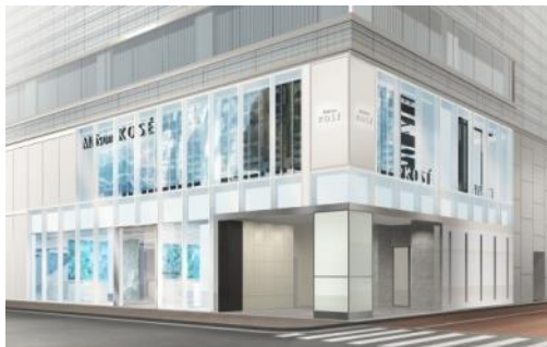
メゾン コーセー 「Maison KOSÉ」外観イメージ