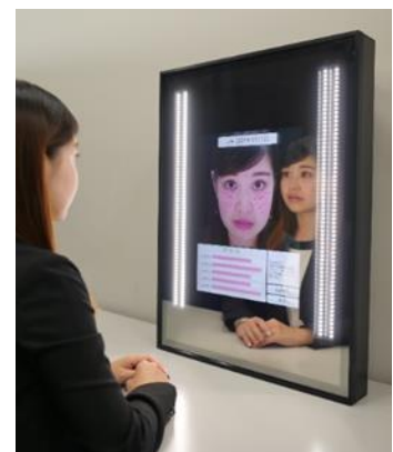
Snow Beauty Mirror (シミ測定)

鏡の前に座るだけで、お客さまの肌状態を分析し、瞬時に数値化し表示します。鏡の中に埋め込まれた非接触センサーが、肌表面と表面下の状態を検出。医療機器と同等レベルの精度で、肌表面のシミ・シワ・ほうれい線・毛穴・肌色だけでなく、目では見えない隠れたシミも検出します。デジタルカウンセリングとその分析結果をもとに、当社の展開する複数のブランド※1を横断した最適な商品やサービスから、お客さまに最適なアイテムをリコメンドします。また、分析結果はデータとして蓄積されるため、過去の肌状態との変化を画像やスコアで比較確認できます。この機能には、デジタルカメラなどで利用される顔認識技術や、画像処理技術などを応用しています。