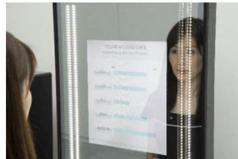
Snow Beauty Mirror (肌5項目の肌測定結果表示)

現在、生活者の価値観やライフスタイルは多様化し、化粧品に求めるニーズ自体が百人百様の時代となっています。一方で、インターネットや SNS の普及などにより情報があふれ、本当に自分にあった化粧品を選ぶことがかえって難しい場面も増えています。そのような悩みの解決策のひとつが、デジタル技術とデータを活用した、お一人おひとりに最適な商品とサービスをご紹介するパーソナライズ提案です。