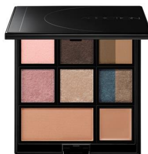
コンパクト 10 リミテッドエディション アイコンシヤス アディクション

今回発売する製品のうち、メインアイテムの「コンパクト 10 リミテッドエディション アイコンシヤス アディクション」は、メイクアップに必要なアイテムが揃ったオールインワンのパレットです。10周年を記念し、ブランドを代表する「ザ アイシャドウ」をはじめ、ベストコスメ受賞アイテムや、人気カラーの復刻まで、これまでのアディクションの集大成をコンパクトに詰め込みました。1つでメイクアップが完成するオールインワンコンパクト3種、ベースメイクアップ用コンパクト3種、アーティストブランドならではの色揃えのリップ・チーク・コンシーラーに特化したコンパクト3種、ユニセックス仕様のコンパクト1種の計10種類を取り揃えました。豊富なカラーバリエーションと絶妙な色の組み合わせで、幅広いお客さまの好みにきめ細かく応えます。また、今回限りの限定新色も加わった、10周年ならではの特別感と実用性のあるアイテムです。