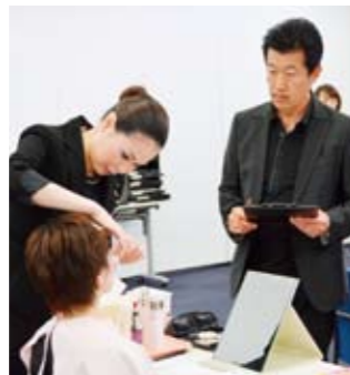
審査員が施術中の立ち居振る舞いや笑顔、会話、テクニクなどを細かく審査

2009年からは海外7カ国でも国内と同様の方法でコンテストを開催するなど、EMBコンテストは国内外の美容スタッフのスキルアップに役立っています。