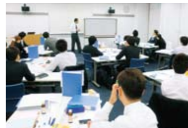
3人一組となって講師の話に耳を傾ける様子

ています。なかでも2009年から始めた「ビジネスリーダー育成塾」は、「自ら磨く」をコンセプトに、年間5回のカリキュラムで開催されています。社員の自主参加形式で実施され、将来のビジネスリーダーを目指して、実践的な論理的思考力・プレゼンテーション能力といった知識を学びます。参加者からは、「少人数でチームを組んで切磋琢磨し、最終日には社長へ新規事業をプレゼンするという貴重な経験ができた」などの声があり、大変好評でした。今後も多様な相互啓発を通じて、コーセーの成長を牽引するリーダーを育成していきます。