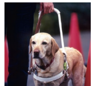
盲導犬の普及をサポート