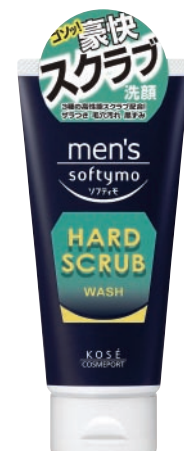
カラーバリアフリー商品

コーセーグループはお客様をはじめ企業を取り巻く全ての人々、地域社会、国際社会とよりよい共生をはかって行きたいと考えています。そのために様々な活動に積極的に取り組んでいます。