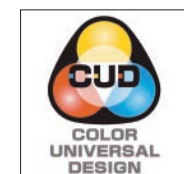
カラーユニバーサルデザインのシンボルマーク