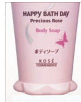
ハッピーバスデイシリーズはお客さまの声で倒れにくいボトルデザインに変更

コーセーでは愛用者とのコミュニケーションの窓口として「お客さま相談室」を開設しています。使い方の説明や肌についてのお問い合わせ、商品に対するご意見などに、専門のスタッフが対応していますが、中でも商品に対するご提案は、社内の関係部署に素早く伝達する「スマイルデータシステム」を構築し、運営しています。このシステムによって改良された例にハッピーバスデイシリーズのボトルデザイン、シャンプーの詰め替え容器の注ぎ口の変更、アイライナー容器の表示方法などがあります。