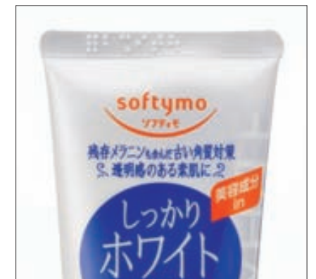
今まで難しいとされたチューブ製品にも点字の表示を

2008年度からの新しい取り組みとして、多様な色覚を持つ人々にもきちんと情報が伝わるような色遣いやデザインに考慮したカラーバリアフリー商品を発売しています。現在はコスメジックシリーズやサンカット製品、メンズソフティモシリーズの一部の製品など13品ですが、今後も順次アイテムを増やしていく予定です。