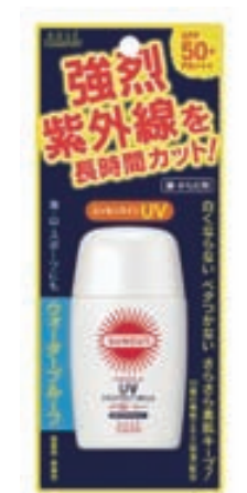
読みやすさに工夫した日焼け止め