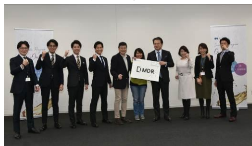
採択企業：株式会社 MDR との共創チーム