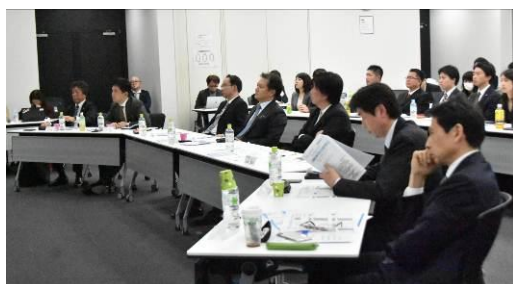
事業プランを聞く審査員