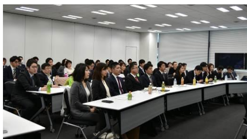
デモデイに参加する共創チームメンバー

【参考資料】第1回アクセラレータープログラム 最終答申会(デモデイ)の様子 <2019年1月30日実施>