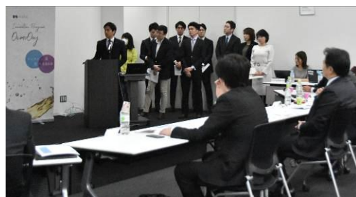
プレゼンテーション