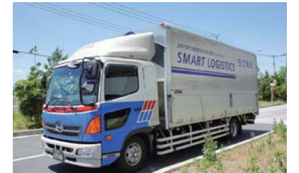
高品質かつ効率的な物流を実現

また、1997年に発足した「コスメ物流フォーラム21」では、化粧品メーカー6社の物流部門が討議し、日本各地(北海道・東北・北陸・中部・中国・四国・九州・沖縄)で化粧品の発注・配送の共同化を実現しています。この共同配送をおこなうことにより、販売店様の荷受け作業の効率化および納品車両運行回数の削減によるCO 2 排出量の削減に貢献しています。更なるエリア拡大について現在も検討を続けています。