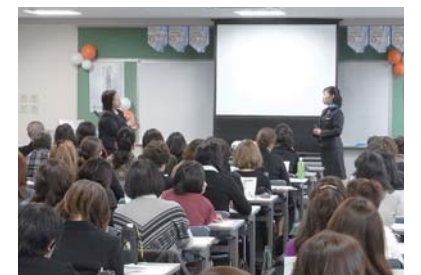
ブランドの特徴を学ぶ導入研修

また、当社にとって販売店様は地域との関係を深めるための大切なパートナーでもあります。一例として、販売店様と当社が合同で地域の高齢者の方々にメイク講習を行うという取り組みがあります。コーセーグループは今後もお取引先との信頼関係を築き、確かな美容スキルでお客さまの気持ちに寄り添う接客の追求に努めていきます。