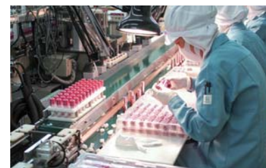
全ての商品に高い品質基準を設定しています

準に照らして工場内の環境や工程に関する監査を行っており、また継続して、定期的な品質監査も実施しています。高品質維持のための連携を通じ、生産委託先企業との相互発展を図っています。