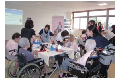
山口県の販売店様と合同で高齢者の方へのメイク講習を実施