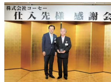
方針説明会の様子

年に1度開催している方針説明会では、特に業績や品質向上、環境配慮などに大きく貢献していただいた仕入れ先様へ感謝の意をこめ表彰を行っています。2014年度は60社を超える仕入れ先様に参加頂き、品質向上・環境・CSR配慮への継続的な協力を呼びかけました。