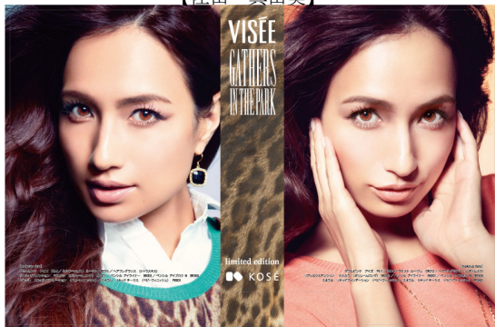
【主張あるグラマラス】