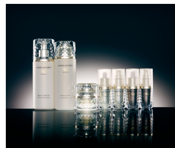
コスメデコルテ AQ ミリオリティ

現在コスメデコルテでは、ハイプレステージブランドとして化粧品で出来る最高の品質をかなえた最高級の『コスメデコルテAQ』の他、美白ラインの『ホワイトサイエンス プレミアム』、アンチエイジングを見据えた『バイタルサイエンス プレミアム』など、女性の肌ニーズに応じたスキンケア・ベースメイクアップのラインを揃えています。最先端のテクノロジーが一年も経たずに過去のものとなる、変化の激しい化粧品業界の中で、ロングセラー商品が多くあり、現在も愛用者が増え続けていることがブランドとしての信頼を更に高めていると確信しています。