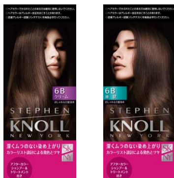
(左) 「カラークチュール クリームヘアカラー(医薬部外品)」 (右) 「カラークチュール 液状ヘアカラー(医薬部外品)」 〈おしゃれな白髪染め〉