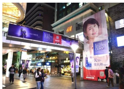
中心街をジャック