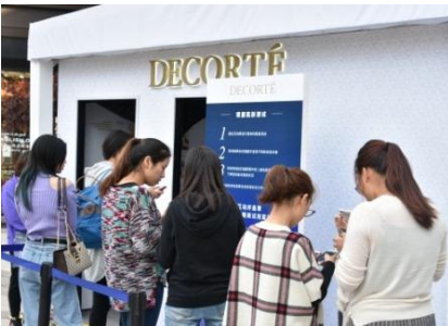
『コスメデコルテ』体感ブース