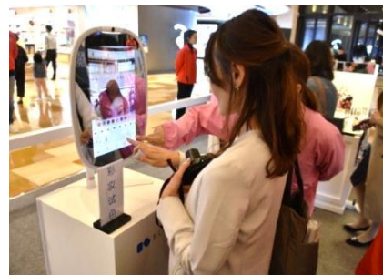
メイクアップシミュレーターで 自分に似合った色探し