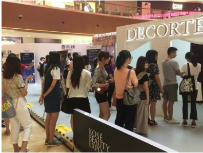
『コスメデコルテ』体感ブース