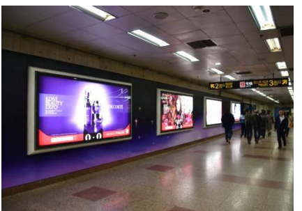
地下鉄コンコースをジャック