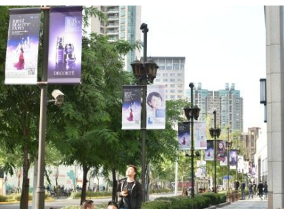
街中に広告を展開