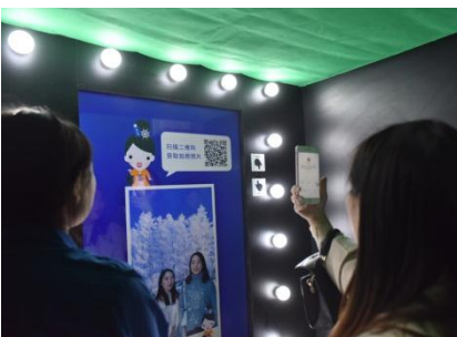
『雪肌精』体感ブース