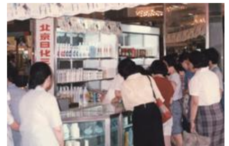
香港 百貨店でのイベント(1960年代)