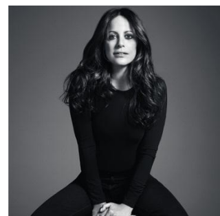
Jill Stuart 氏

日本をはじめ、世界中の若い女性から圧倒的な支持を受けるファッションデザイナー。レディースウェアメーカーを経営する両親のもと、ニューヨークで育つ。15歳で発表したジュエリーとバッグの初コレクションが米国有名百貨店ブルーミングデールズの目に留まる。本格的にファッションデザインを学び、27歳で「JILL STUART」を設立。ニューヨークソーホーに旗艦店をオープンし、1993年ファッションブランドとしてニューヨークコレクションでデビュー。その後、ブランド設立10年の節目を経て、2005年にコスメティックブランドの展開をスタート。