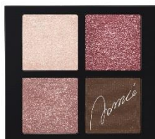
ボルドーブラウン系