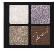
グレイッシュブラウン系