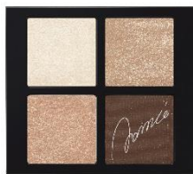
ゴールドブラウン系