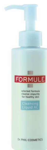
商品名 : フォルミュール クレンジング リキッド AC 容 量 : 150mL

※1 EPC[(アスコルビル/トコフェリル)リン酸K]・ビタミン B6 誘導体 [ピリドキシン HCl]・サンショウエキス[サンショウ果皮エキス]・グリセリン[保湿]