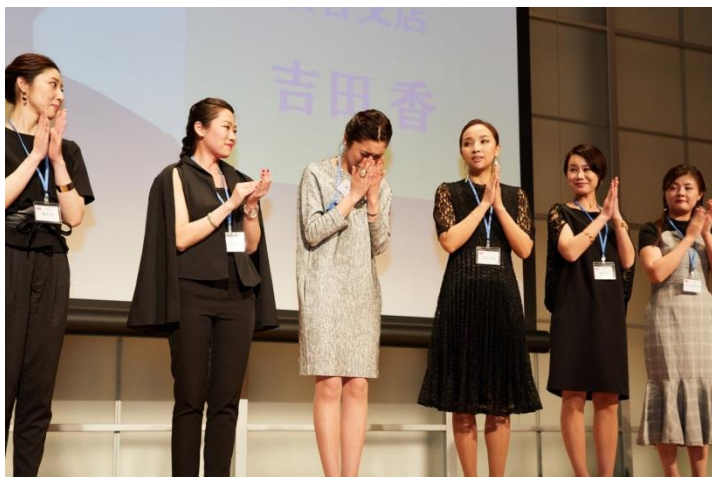
グランプリ発表の瞬間

※EMBとは、E:Expectation M:Meet B:Beyond の頭文字を取った造語で“期待に応え、期待を超える”の意味。