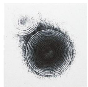
多重層リポソーム電子顕微鏡写真