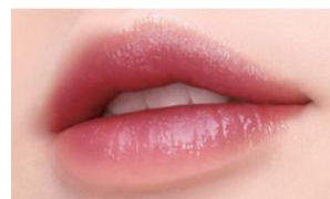
グラデーションリップのイメージ

近年、しっかり作り込んだフルメイクよりも、“抜け感”のあるメイクの方が、シンプルなのにどこか色気を感じさせると支持されています。仕上げるまでに手間がかかるとされていた血色感のある「グラデーションリップ」を簡単に仕上げることができる口紅を『ヴィセ リシェ』から発売することで、顧客接点の拡大を図ります。